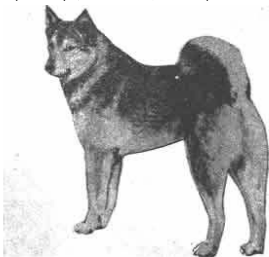
ланка с отличным экстерьером

Шерстный покров развит хорошо. Подразделяется на грубый густой прямой остевой волос и на густой мягкий и пышный подшерсток. На шее и плечах заметный воротник, а у кобелей — загривок. Не допускается курчавость, лохматость, волнистость, короткий или длинный шерстный покров, подвес на хвосте, очесы на передних конечностях, и — большое опушение с внутренней стороны уха.