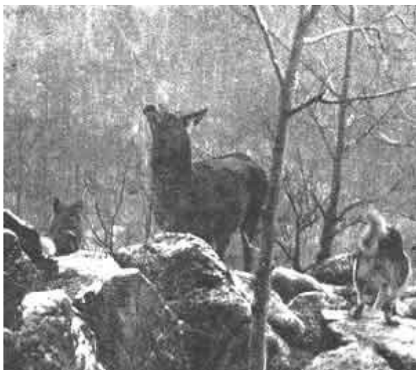
Лайки удерживают изюбра на «отстое»

Из табл. 2 видно, что в большинстве обследованных районов производительность труда при охоте с лайкой значительно выше, чем при добыче самоловами. Лишь в Северо-Байкальском районе, где рано выпал обильный снег, результаты промысла с собакой ниже.